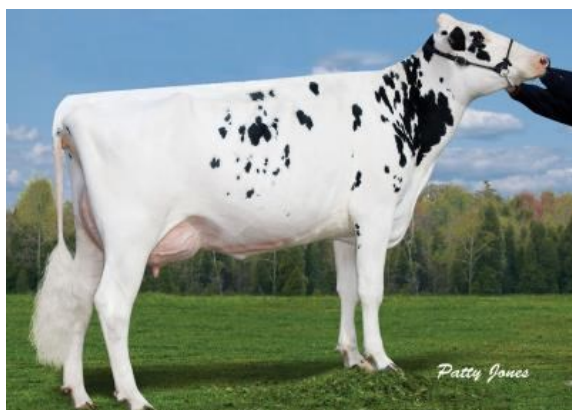
MGGD: GEN-I-BEQ SHOTTLE BOMBI