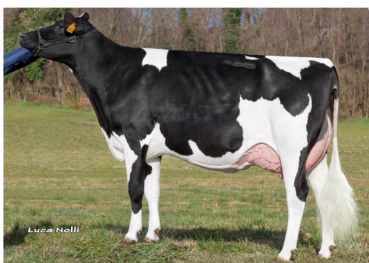
MATKA: CERESIO MOGUL LAICA