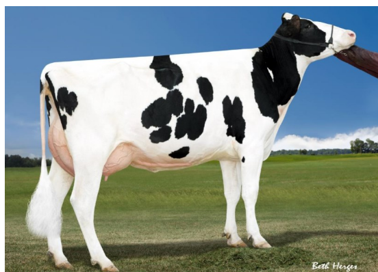
MISS OCD ROBST DELICIOUS