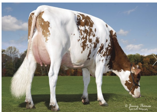
PLAIN-KNOLL RAGER 961-RED