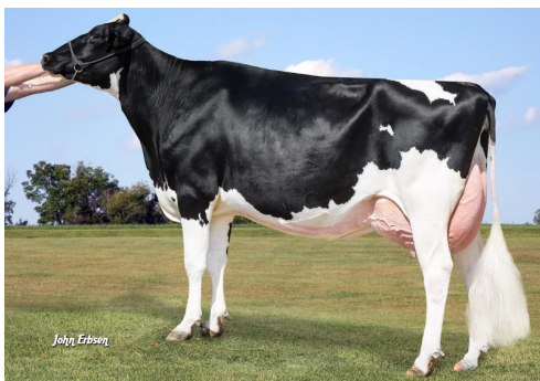
Matka: REDROCK-VIEW KINGBOY 367-ET