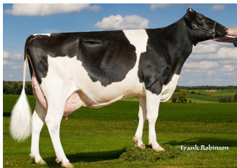
ST ALANA RUB 54761

- VELMI VYSOKÁ PRODUKCE MLÉKA S POZITIVNÍMI SLOŽKAMI